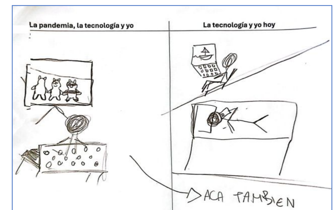
CABA, 5to grado, gestión privada