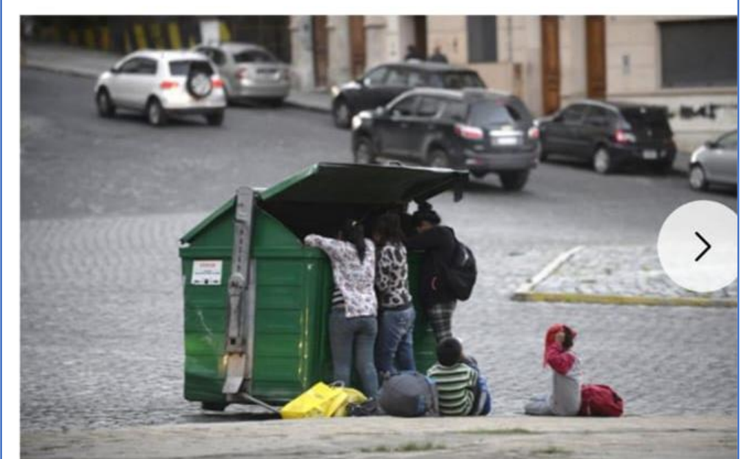
FOTO: Ilustrativa.- Pobreza en Rosario.