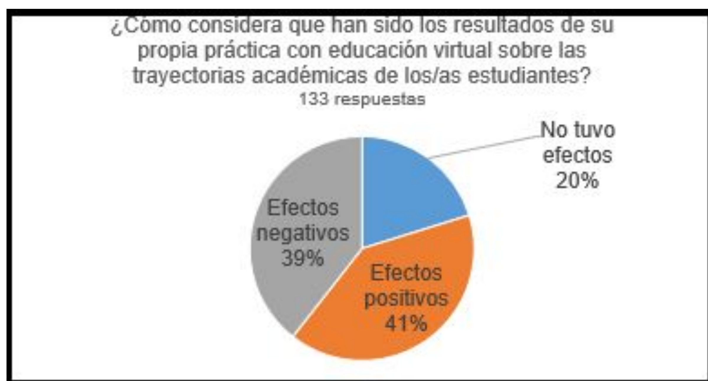
Figura 1. Percepción docente sobre los efectos de la propia práctica educativa virtual sobre las trayectorias académicas de los estudiantes

El 20 % de lxs docentes indicó que trabajar con herramientas de entornos virtuales de enseñanza les conllevó un grado moderado o alto de dificultad para adaptarse, mientras que el 80 % refirió una dificultad intermedia o escasa. Por su parte, la mayoría de lxs estudiantes evaluó su experiencia en el cursado virtual como positiva (83%). El 48 % del estudiantado la consideró “buena”, 27 % como “muy buena” y 8 % “excelente”. El 20% de lxs docentes consideró que su práctica educativa personal a través de entornos virtuales de enseñanza no ha tenido efectos ni positivos ni negativos sobre las trayectorias académicas de lxs estudiantes. La mayor parte de lxs docentes (80 %), consideró que ha existido una influencia: el 40 % considera que ha sido positiva, mientras que el 39 % la considera negativa. Lxs estudiantes tienen una percepción principalmente positiva sobre el grado en que han podido apropiarse de los contenidos impartidos a través de entornos virtuales: el 33 % lo considera “excelente o muy bueno”, la mayoría (51 %) como “bueno” y el 16 % como “escaso”.