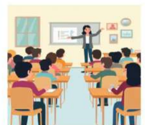
Figura 1. Imagen ilustrativa del modelo de educación bancaria